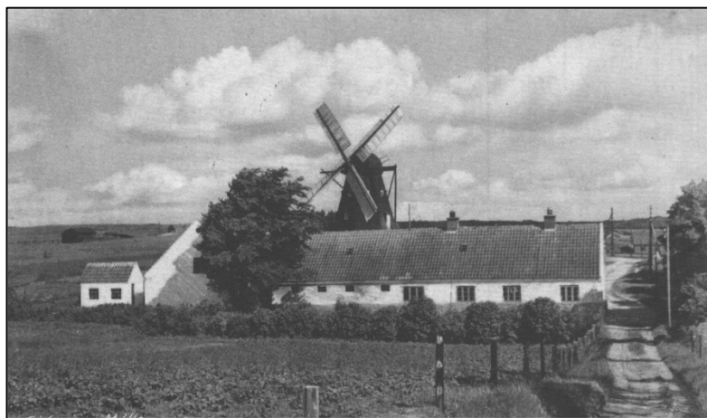
Bakmøllen med møllegård