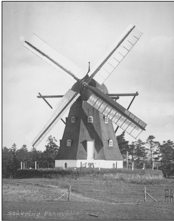
Bakmøllen klar til dagens dont

banevogne. Vingerne på tilsammen 120 fod af American Pine bliver fornyet hos en mølle-bygger i Brovst og hele møllen bliver repareret for i alt 10.000 kr. Hans egen vurdering er, at der kommer en fin mølle ud af det. Først i efteråret 1944 er møllen repareret: