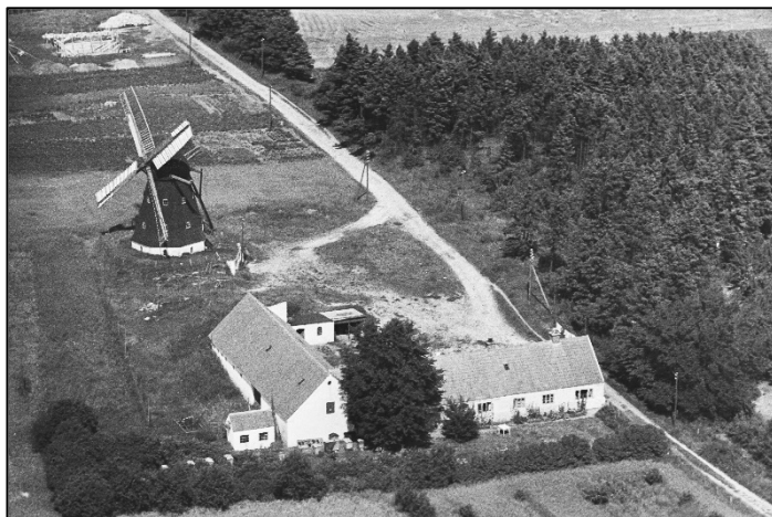
Bakmøllen i Støvring kort før den blev revet ned i 1950.

I det område, der dannede Støvring Kommune, har der ligget en række vindmøller, der alle forarbejdede korn til mel. De er alle for længst revet ned, men heldigvis har vi fotos og arkivalier, der fortæller, hvordan møllerne så ud, hvem der drev dem, og hvordan produktionen foregik.