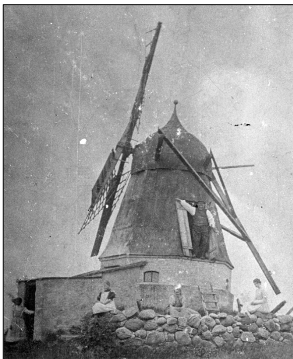
Ejer af Hæsumgård Jens Qvist står i døren til Hæsum Mølle omkring år 1900, mens døtrene har stillet sig til fotografering