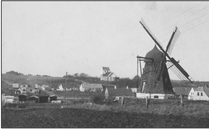
Øster Hornum mølle på Estrupvej