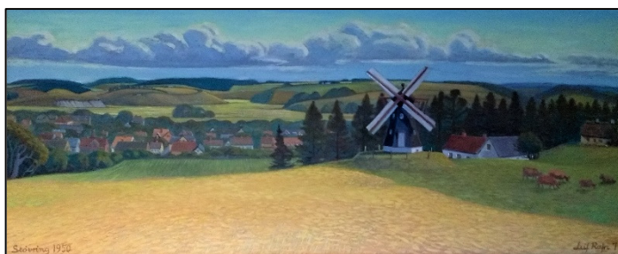
Leif Rafn malede i 1971 dette billede, hvor Bakmøllen ses i forgrunde med Støvring ligger nede i dalen – som han husker stedet så ud i 1950