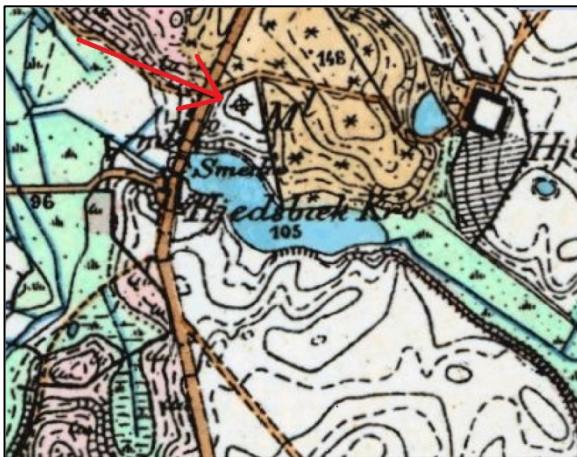
Hjedsbæk Mølle lå, hvor pilen peger