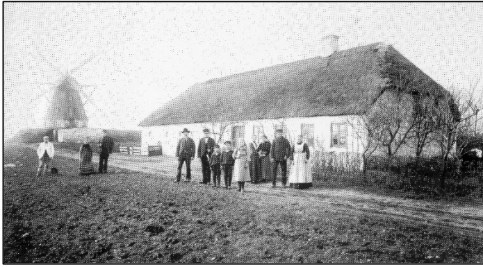
Torsted Mølle bygget på Storhøjen umiddelbart bag ved Torstedvej 53.