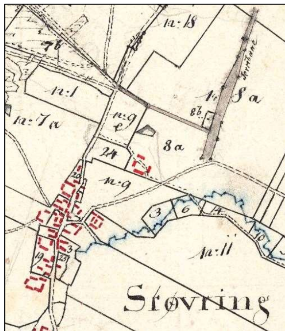
Kortet viser Støvring på det tidspunkt, hvor planerne om jernbanen og dermed Jernbanegade var under udvikling

Mere end 20 år før Støvring Station blev åbnet, fremkom i 1845 det første seriøse jernbane-projekt i Jylland. Stænderforsamlingen i Viborg foreslog en jernbane fra den dansk-tyske grænse via Silkeborg-Viborg til "et passende sted ved Limfjorden". Dette "Midtbaneforslag" havde et forløb omtrent som den gamle Hærvej og tilgodeså den dengang vigtige midtjyske studeeksport til Nordtyskland. Midtbanen blev kort tid efter foreslået videreført fra Viborg til Aalborg gennem den vestlige Rold Skov og dermed gennem det vestlige Buderup sogn muligvis med en station ved Sørup. Landsbyen Sørup, der i midten af 1800-tallet var større end landsbyen Støvring, ville med en station formentlig have udviklet sig til en stationsby på størrelse med det nuværende Støvring, og vores storkommune ville måske have heddet Sørup kommune.