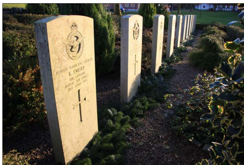
Gravstedet på Aarestrup Kirkegård vinterpyntet julen 2011

De 11 gravsten er alle ens i højde med afrundet top, udført i samme hvide sten. Hver sten er forsynet med den afdødes navn og militære rang samt personlige data, hvor disse kendes. Stenenes udformning adskiller sig kun fra hinanden ved at de nationale symboler er forskellige. Dog ses at hollænderen Guilonards sten adskiller sig i formen fra de øvrige.