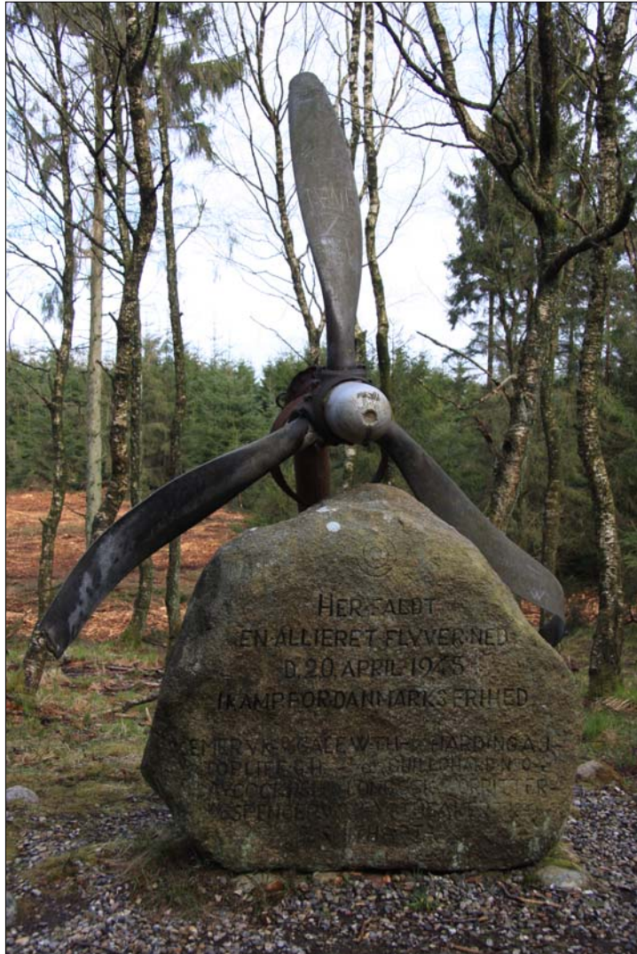
”Flyverstenen” i Torstedlund Skov foråret 2012

Samlet og redigeret af Niels Nørgaard Nielsen Lokalhistorisk Arkiv for den tidligere Støvring Kommune