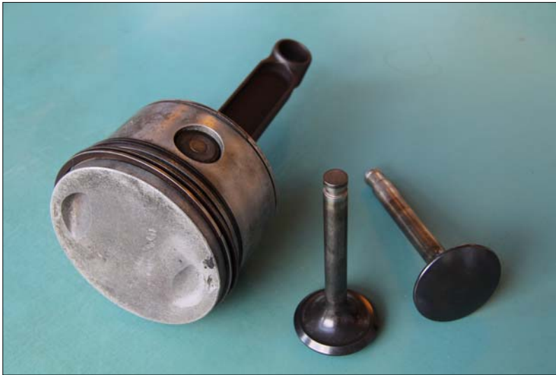
Stempel og ventiler fra en af flyets motorer