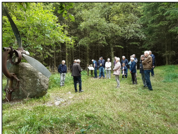
Ved "Flyverstenen" 28. august