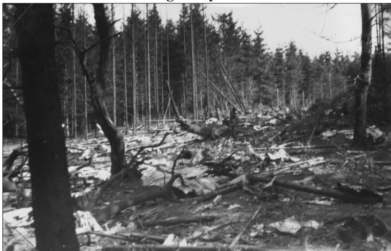
Nedstyrtningsstedet med vragdele og væltede træer

”Til at begynde med, da jeg kom derud hen på eftermiddagen 21. april, var det kun meget unge tyske soldater, vel ikke stort ældre end mig selv, vel i alderen 15 til 17 år gamle, der var til stede ved nedstyrtningsstedet. De gjorde ingenting, så vi kunne uden problemer komme til at gå rundt og kigge på vragdelene og resterne af besætningsmedlemmerne. Der lå én af flyverne, hvis øverste del af hovedet var sprængt væk, det husker jeg endnu.