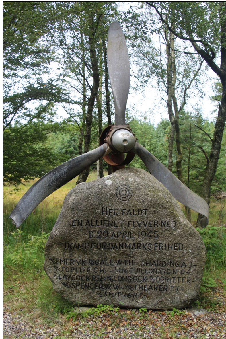
”Flyverstenen” i Torstedlund Skov

Nu er 3. udvidede udgave udkommet, 92 sider – 50 kroner.