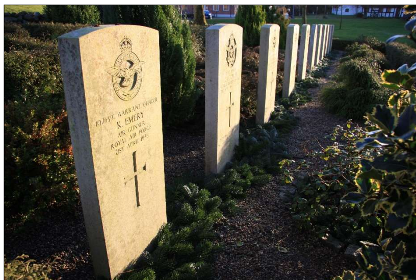
Gravstedet på Aarestrup Kirkegård vinterpyntet julen 2011

De 11 gravsten er alle ens i højde med afrundet top, udført i samme hvide sten. Hver sten er forsynet med den afdødes navn og militære rang samt personlige data, hvor disse kendes. Ste-nenes udformning adskiller sig kun fra hinanden ved at de nationale symboler er forskellige. Dog ses at hollænderen Guilonards sten adskiller sig i formen fra de øvrige.