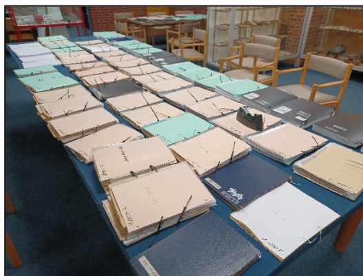
Der sorteres og registreres i det indleverede materiale