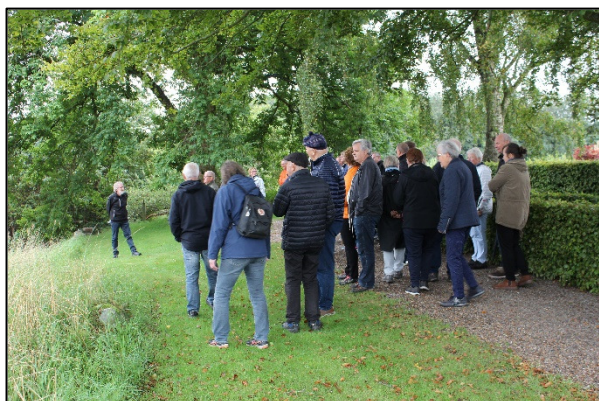
Historisk byvandring i Øster Hornum under kulturugerne