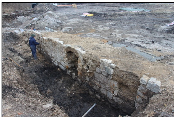
Formidling om udgravning af Støvring Vandmølle