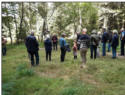
Det blev afholdt tur til Flyverstenen og et foredrag om Suldrup før og nu.