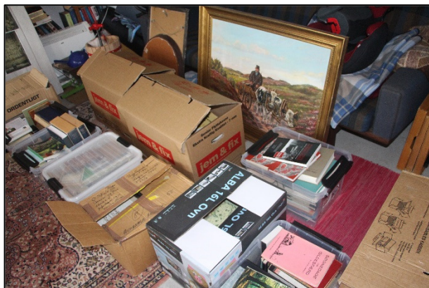
En større indlevering klar til sortering og registrering