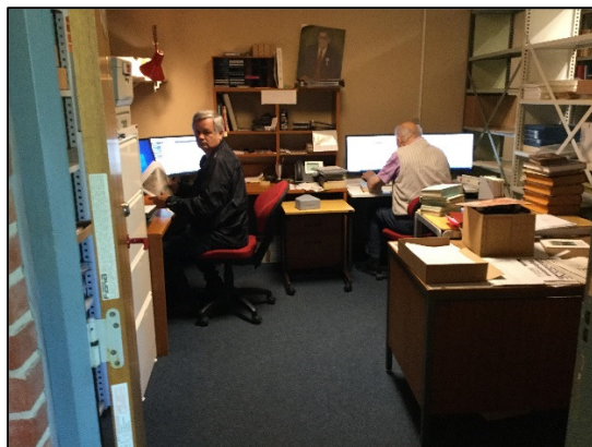
Der registreres bøger en tidlig vintermorgen