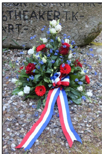
Buket ved Flyverstenen 20. maj