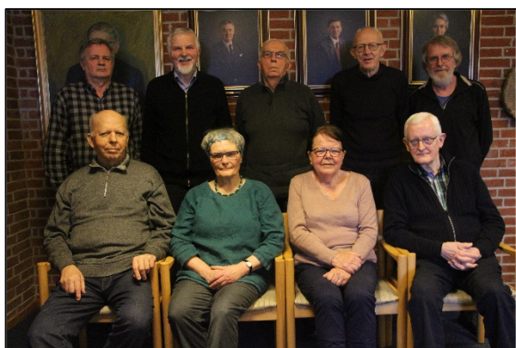
Bestyrelsen, valgt på generalforsamlingen 10. marts 2020

Arkivet har fået egen indgangsdør og alarmsystemet er fornyet, så det fungerer uafhængigt af skolens.