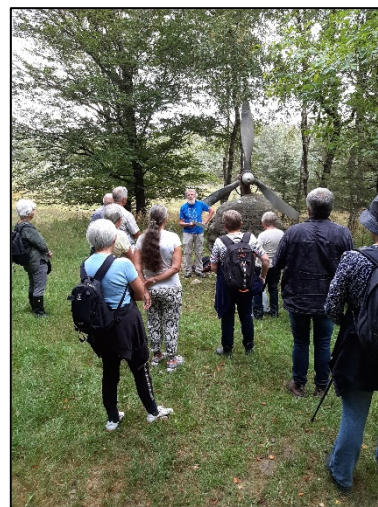
Guidet tur til Flyverstenen en dejlig sommerdag