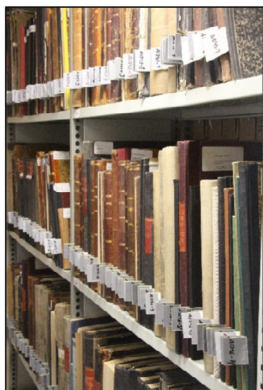
Protokollerne er nu registrerede og sat på plads

Et stort arbejde med at registrere Arkivets omkring 1300 bøger nærmer sig en afslutning. Den store mængde protokoller, der hidtil ikke har været registrerede, er nu kommet med i systemet. Dette arbejde var kun muligt i lukningsperioden, da det var nødvendigt at sortere protokollerne rent fysisk, hvilket krævede megen bordplads, som ikke ville kunne tilvejebringes, hvis Arkivet skulle have fungeret på sædvanlig vis.