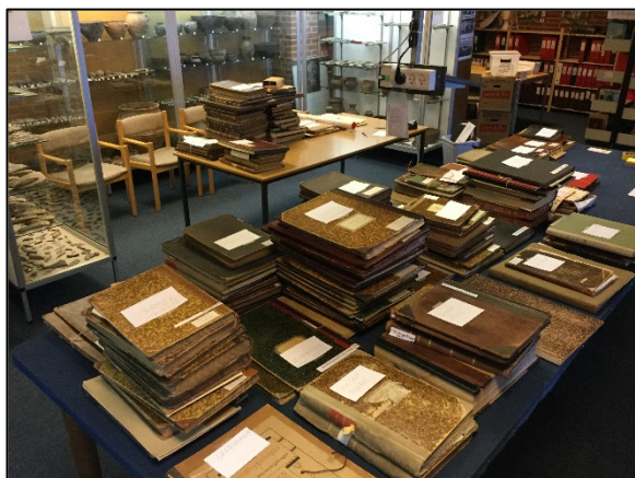
Det fyldte godt op, da de mange protokoller skulle sorteres og registreres