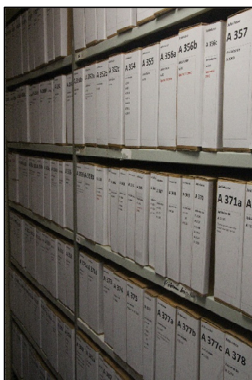
Nogle af de mange hylde-mer arkivalier

Alle Arkivets film/DVD'er er nu lagt på serveren og registrerede på Arkiv.dk, hvilket medfører, at også besøgende nu kan se dem på Arkivet.