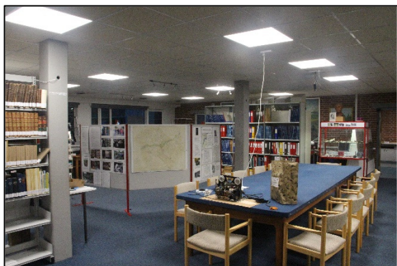
Der er kommet bedre belysning på Arkivet – bag skærmene sover vuggestuens børn til middag, når det er dårligt vejr

Endvidere er der ansat en ny pedel (teknisk serviceleder) pr. 1. august. Bestyrelsen forventer at få et lige så godt samarbejde med ham som med den afgående Finn Såby.