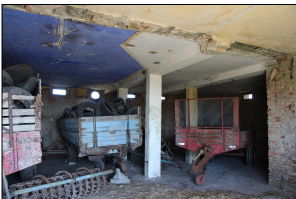
Plotte-rummet på radarstationen Lindwurm

Endelig besøgte resterne af den tyske radarstation Lindwurm i Fræer, også kaldet "Bette berlin", hvorfra flyet sandsynligvis er blevet observeret under indflyvning over området