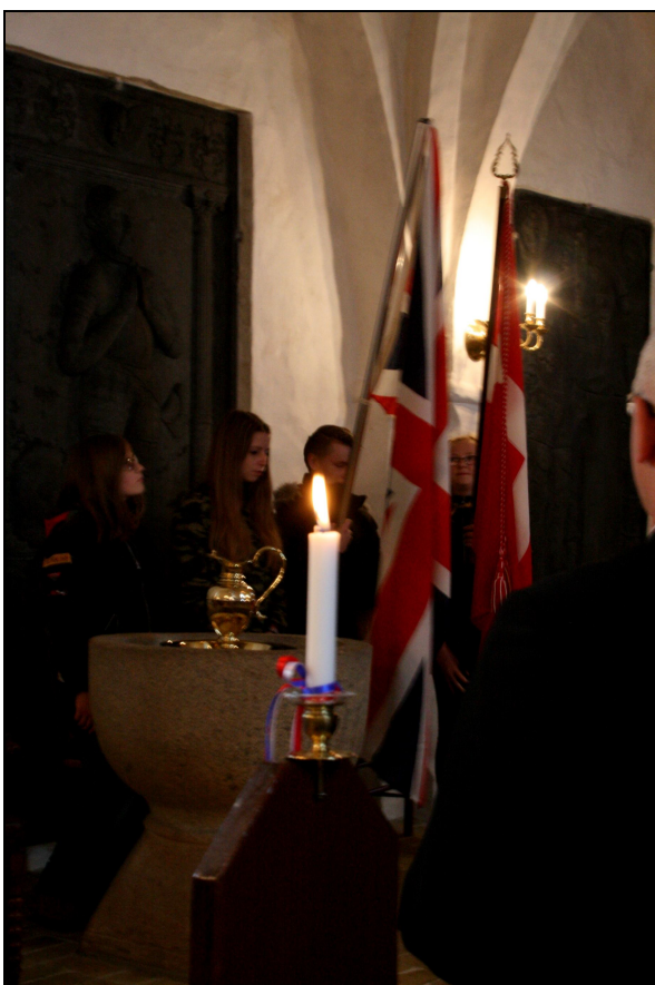
Union Jack og Dannebrog i Aarestrup Kirke

Det absolutte højdepunkt i besøget var uden tvivl mindegudstjenesten i Aarestrup Kirke med deltagelse af op mod 130 mennesker om aftenen 9. maj.