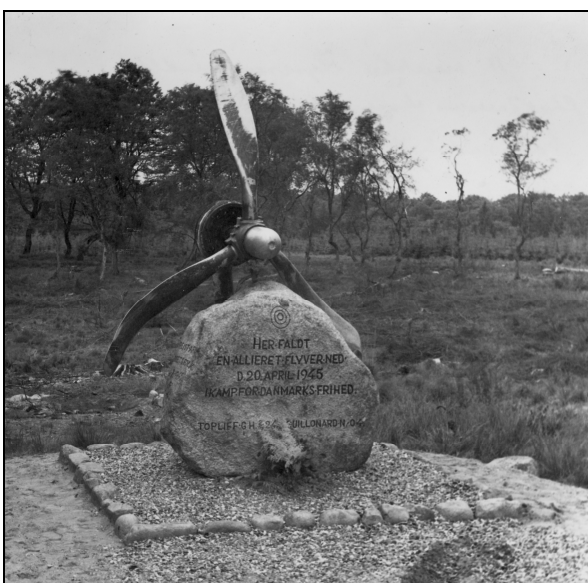
Flyverstenen på nedstyrtningsstedet i Torstedlund Skov kort efter indvielsen

De ombordværende elleve besætningsmedlemmer blev dræbt på stedet og fjernet af tyskerne dagen efter. Hvor tyskerne gjorde af de omkomne vidste ingen.