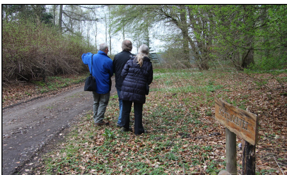
Skuret er nu væk, men stedet det samme

Et af de betydningsfulde er stedet, hvor kisterne med de omkomne havde været opbevaret i dagene mellem fundet i skoven og begravelsen 22. juni 1947.