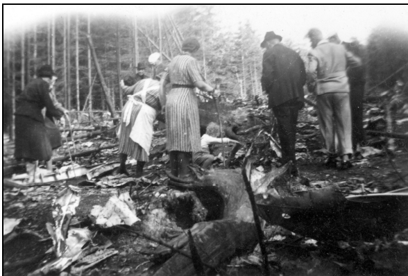
Folk fra Aarestrup går mellem vragedelene på nedstyrtningsstedet få dage efter ulykken