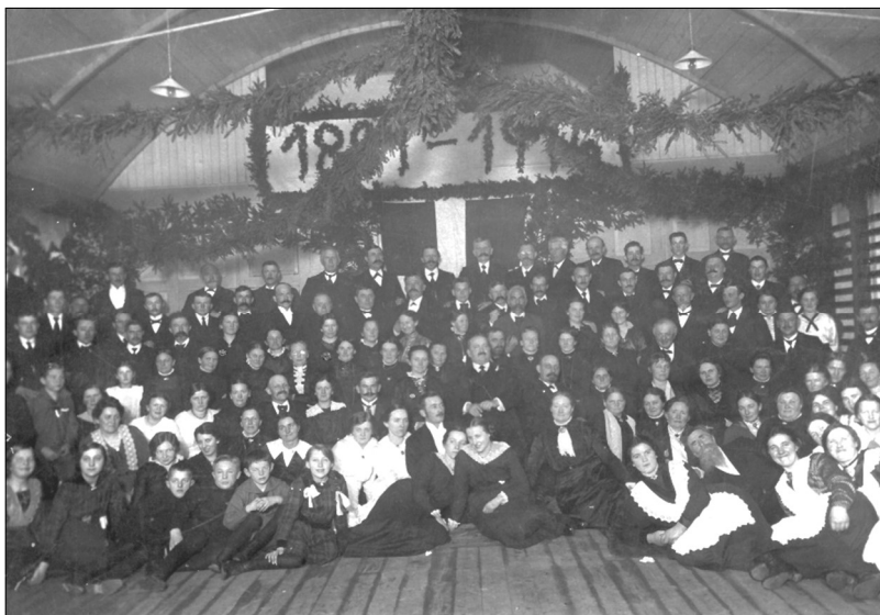
Højskolen benyttede forsamlingshuset ved større arrangementer – her er det dog en større privat fest, der afholdes 1916 i forsamlingshuset